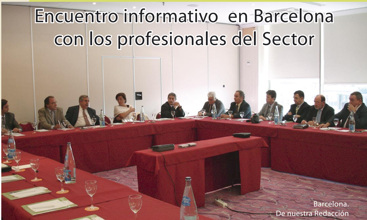
Barcelona. De nuestra Redacción

El pasado día 20 de septiembre, tuvo lugar, en el Hotel Barceló Sants de Barcelona, una reunión de carácter informativo, organizada por 'Mantenimiento y Limpiezas', a la que acudió un nutrido y prestigioso grupo de profesionales catalanes de este sector, especialmente invitados por la Dirección de la revista para hacerles partícipes de las nuevas iniciativas editoriales que se van a poner en marcha en los próximos meses.